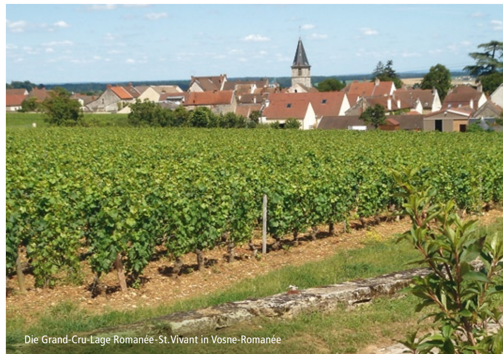
Die Grand-Cru-Lage Romanée-St. Vivant in Vosne-Romanée