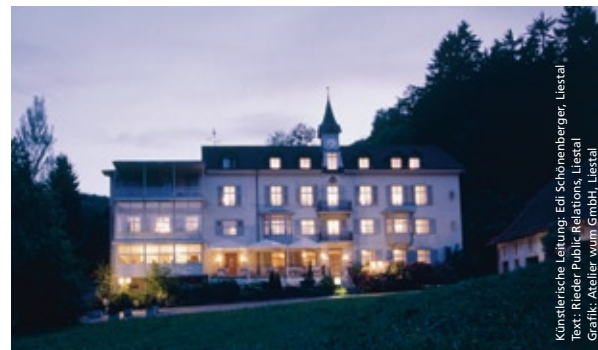
Künstlerische Leitung: Edi Schönenberger, Liestal Text: Rader Public Relations, Liestal Grafik: Atelier wum GmbH, Liestal